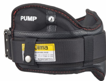
安全帯胴当てベルト『空圧』を胴ベルトで装着した状態。