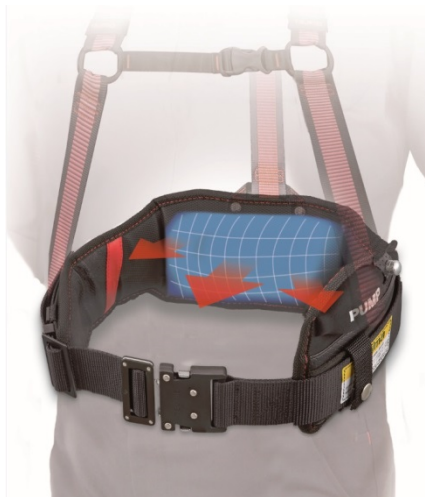
エアクッション機能を示したイラスト。安全帯胴当てベルト『空圧』を胴ベルトで装着した状態。

S 長さ 600×幅(実効)60 mm 重量420g M 長さ 700×幅(実効)70 mm 重量480g L 長さ 800×幅(実効)70 mm 重量520g (ベルト厚はエア抜き状態で 10 mm)