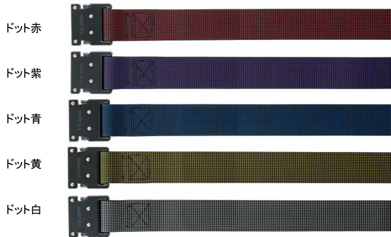
鍛造アルミワンタッチバックル