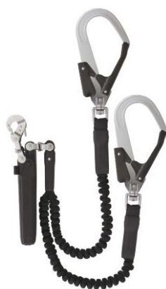
ハーネス用ランヤード ER150 ダブルL6